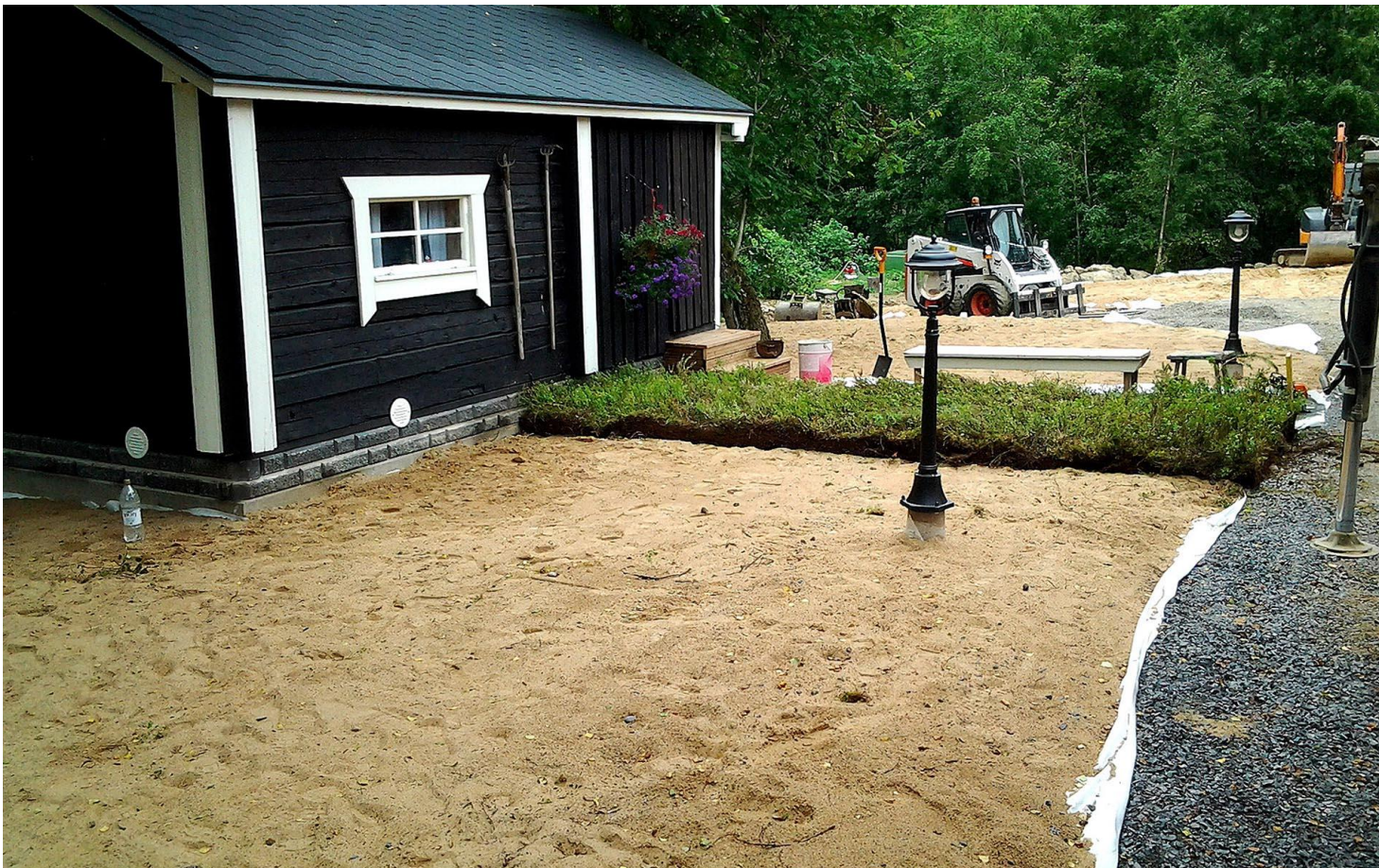
Esimerkki pohjatöistä. Kuntalle tulevalle alueelle on levitetty kangas, jonka päälle noin 10 cm kerros hienojakoista hiekkaa.